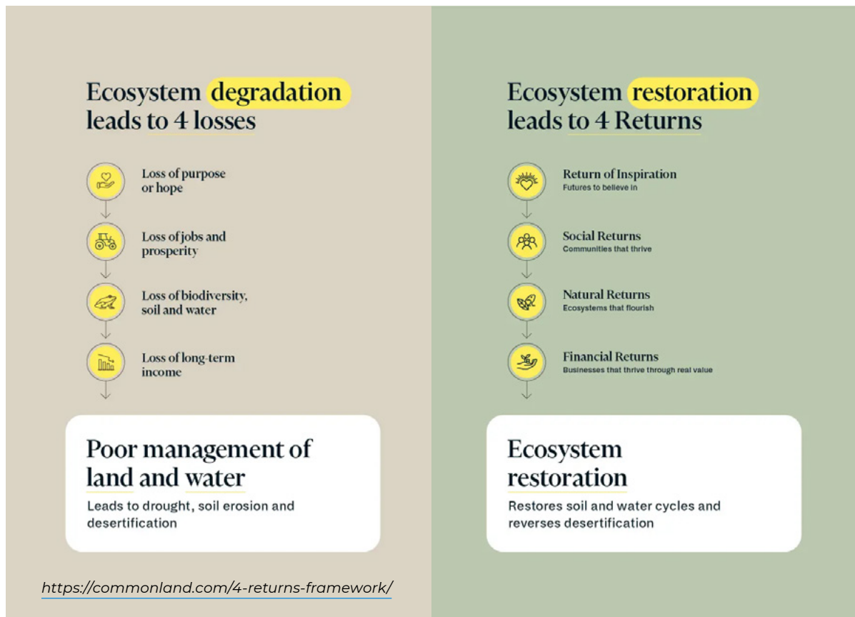
Figuur 3. 4 Returns Framework

Daarbij is het cruciaal te durven vertrouwen op een lange termijnagenda en niet te rekenen op quick wins .