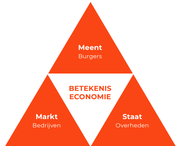
Figuur 2. Markt, staat en meent

Klomp en Oosterwaal (2021, THRIVE, Fundamentals for a new economy)